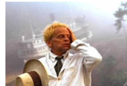
Varför inte bara köra båten över berget? Bild ur - Fitzcarraldo (Herzog) Klaus Kinski