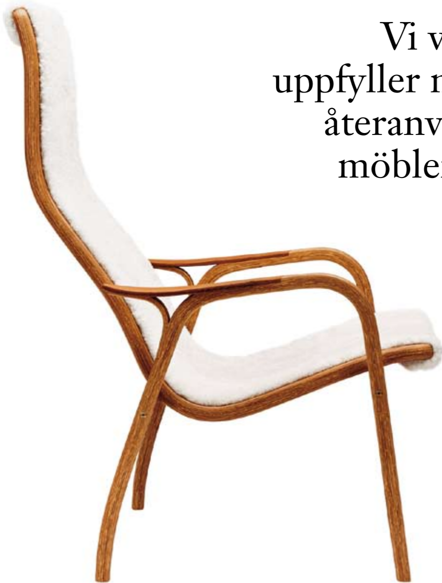
Lamino, formgiven av Yngve Ekström 1952 är lika populär idag och nu även miljömärkt. Det kan man kalla hållbar design!